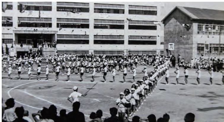
昭和41(1966)年当時の杉並第二小学校。運動会が開催されています。今回解体される鉄筋コンクリート造の校舎の右には、木造の校舎も見えます。鼓笛隊の演技の様で、皆リコーダーを吹いています。