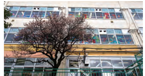
思い出の詰まった旧校舎。すでに解体工事が着手されています。