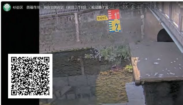
杉並区河川ライブカメラ