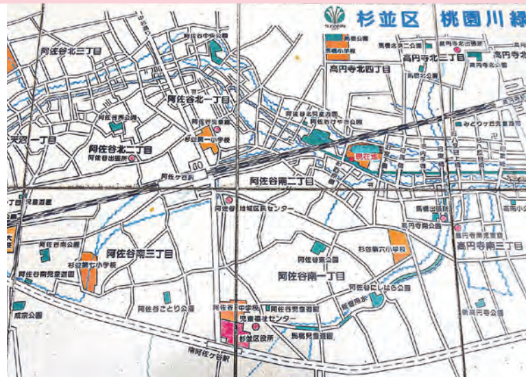
阿佐ヶ谷駅周辺は小河川が多く流れていました。