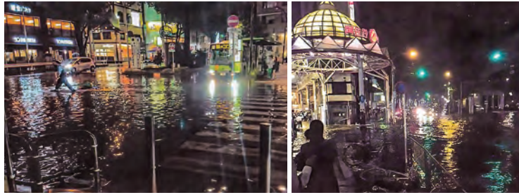
阿佐ヶ谷駅前 平成30年8月27日 集中豪雨

阿佐谷の地名の由来は、文字通り神田川の支流である桃園川の浅い谷地だったことに由来しているそうです。(出典:阿佐ヶ谷ナビ) 今号では水害に対する備えについてふれたいと思います。