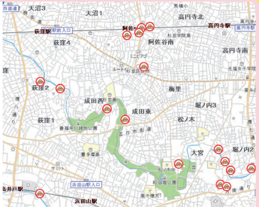
○印は杉並区の土のう置き場です。区民の方が自由に利用できます。

家財を移動させたり、畳を上げたりすることは、とっさの場合なかなかできないものです。あらかじめ、家財の移動の手順や家族の役割分担を決めておけば混乱を防ぐことができます。家周りの整理、特に灯油、ガソリン、農薬などの危険物の安全点検は入念に行いましょう。