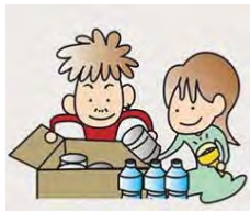
備蓄品を確認しよう