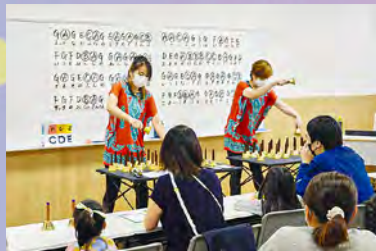
♪ ハンドベルを奏でよう