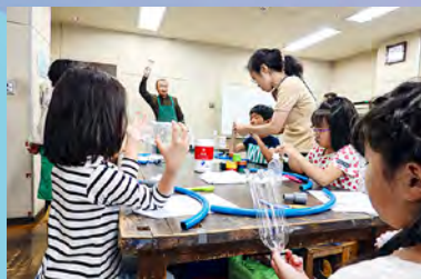
♪ ホースで管楽器づくり