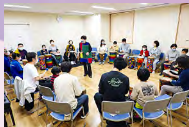
♪ ドラムサークルに挑戦