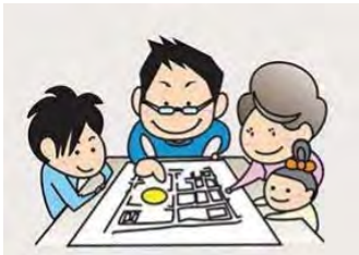
わが家の防災マップを作ろう