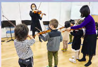
♪ 弦楽器を弾いてみよう