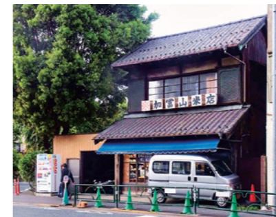
昔ながらの店構えです

看板建築風のお店が残っています。看板建築とは、店舗兼住宅の一形式で道路に面した部分は看板風、建物本体は木造という住宅建物です。そもそも建物の延焼防止から始まったといわれる建築様式で、関東大震災のあとに多く採用されました。道に面した部分を銅板葺き等にする事で、耐火素材で覆い防災の効果を狙ったものでした。また、商店街としての統一感、見栄えの点から、各地で採用されたものです。