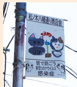
注意喚起のフラッグ