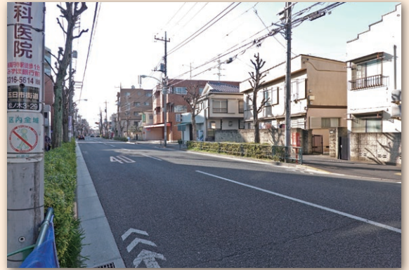
松ノ木梅里五日市通り商興会界限

現在、商興会単独での活動は、ほぼ行っていません。松ノ木地域の商店会と町会との活動である納涼大会や松ノ木防災会に参加している程度です。