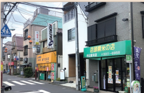
松ノ木八幡通り商店会界限

コロナ禍にあっては、昨年杉並区の補助金により各商店にアルコール消毒液(スタンド型又は卓上型)を配布し、街路灯への注意喚起のフラッグの掲出やポスターを作成し注意喚起に努めてきました。今年は、補助金で各商店に健康管理の面から非接触型体温計の設置を予定しています。また、安全対策上街路灯には防犯カメラが設置されていますが、その管理維持することも商店会の務めであるとしています。総意として、松ノ木八幡通り商店会を存続したいとの思いで活動を続ける意気込みがインタビューを通して感じられました。