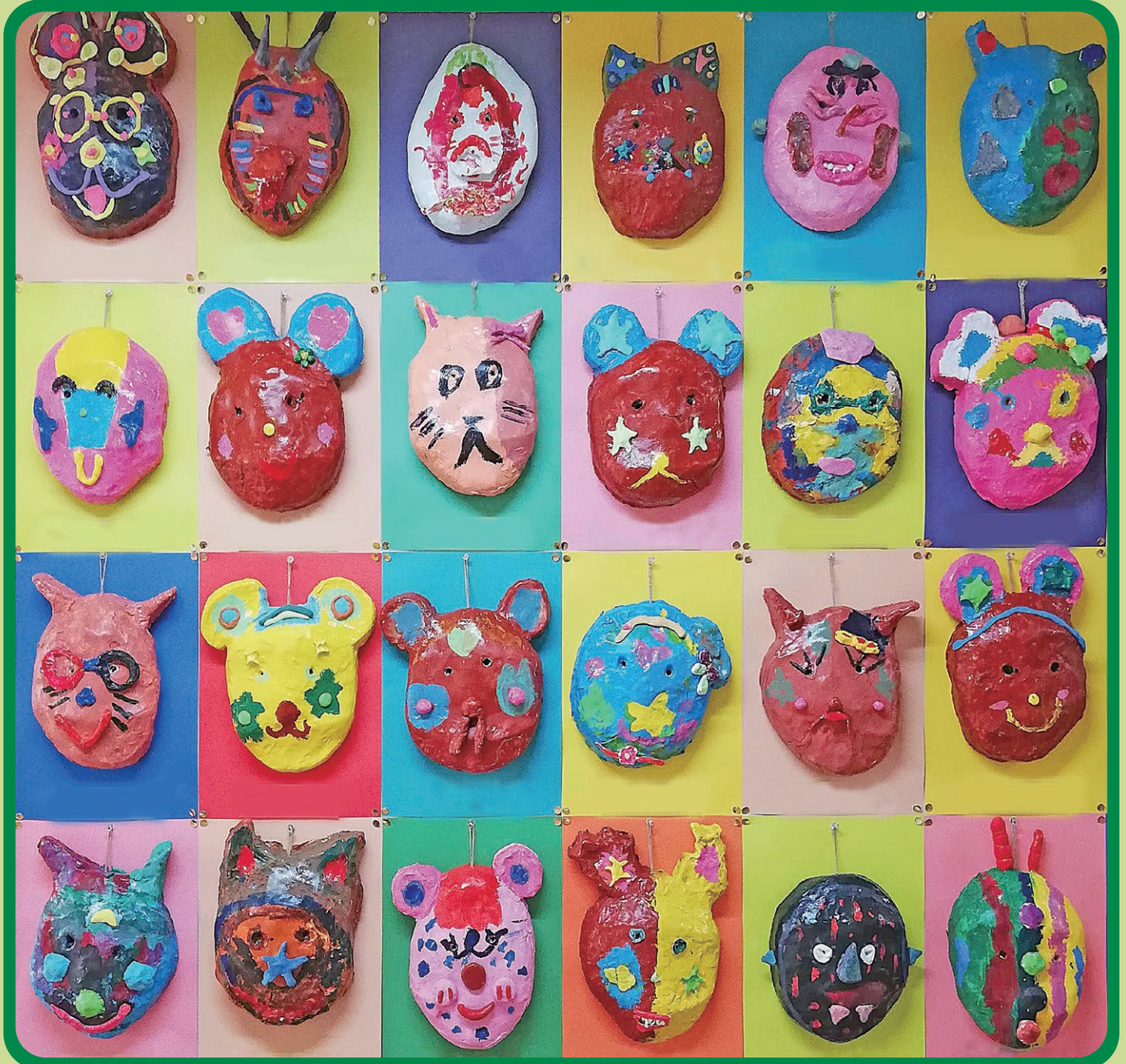
松ノ木小学校 1年生作品 お面でへ〜んしん (2019年2月)