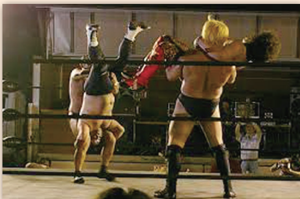
松ノ木地域交流納涼大会 (2008年7月19日)