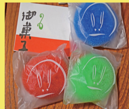
クイズに答えて記念品をゲット (先着順：数に限りあります)